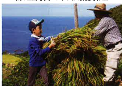
作品名「棚田の守り手」