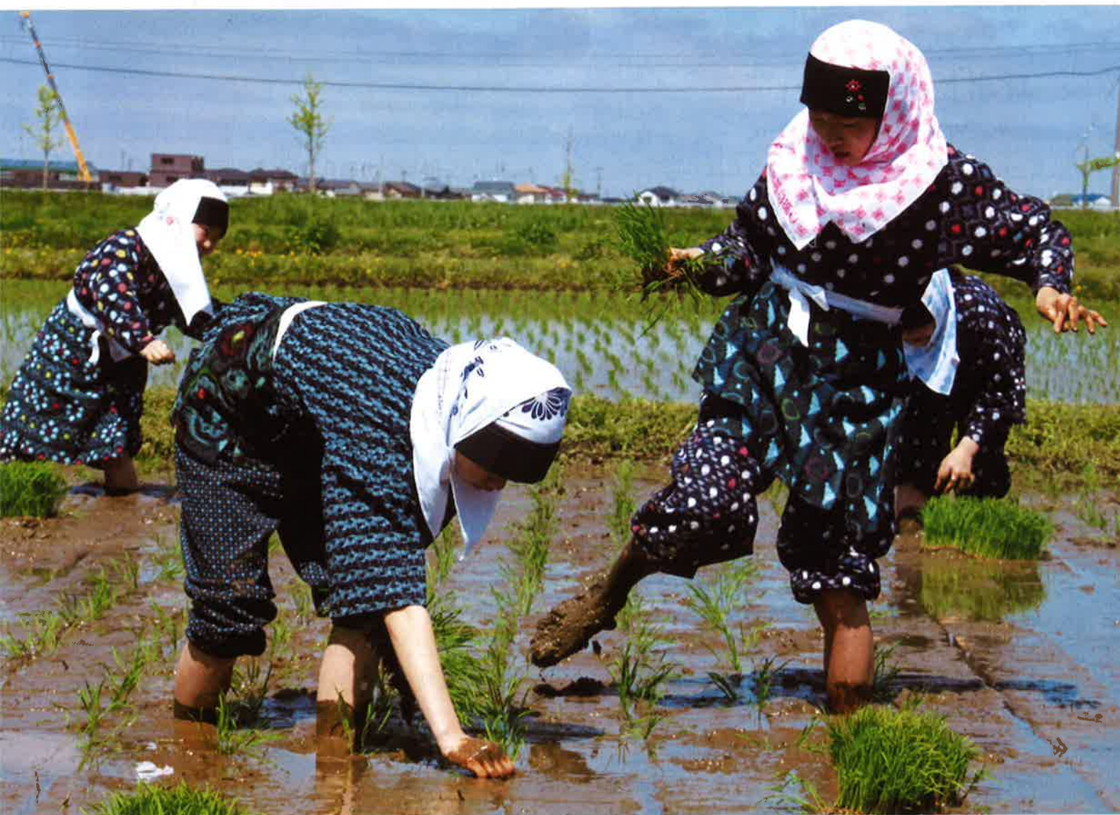
第13回水土里ネット写真コンテスト理事長賞受賞作品「おととと」