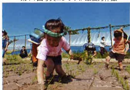
作品名「ねじりハチマキ」