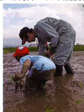
作品名「田んぼの先生」