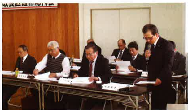
齋藤総括監事による平成29年度第2回定例監査報告