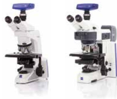
Axiolab 5(左)、Axioscope 5(右)との組み合わせ例