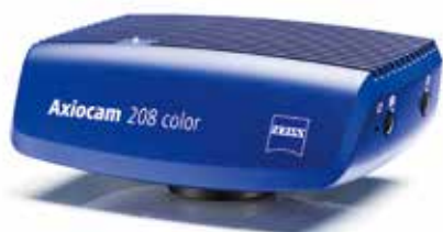
ZEISS Axiocam 208 color