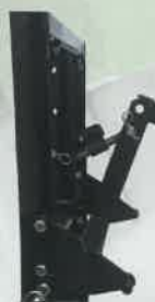
ワンタッチヒッチ仕様